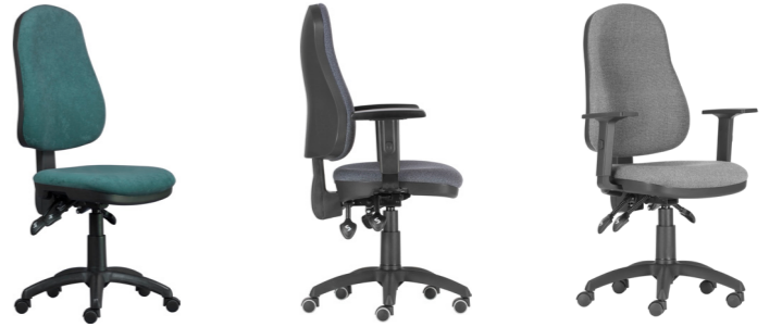
Felix asyn + brațe reglabile