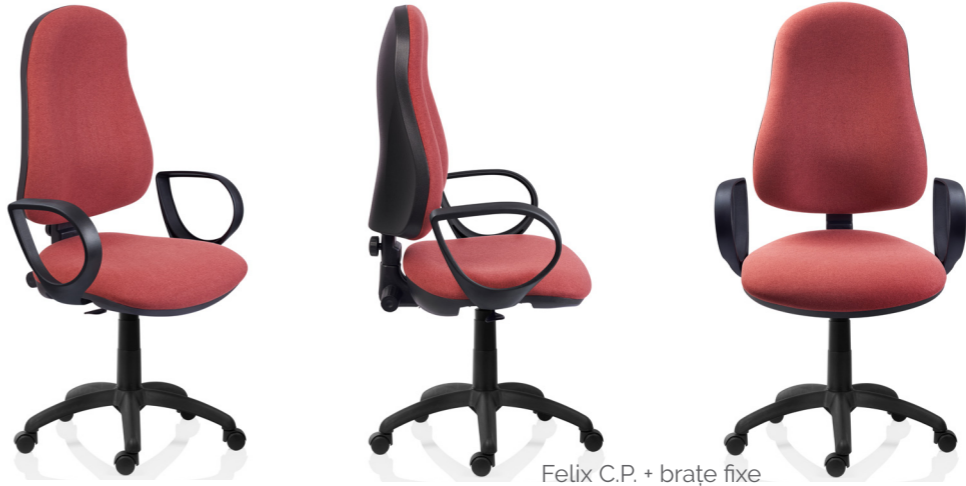
Felix C.P. + brațe fixe